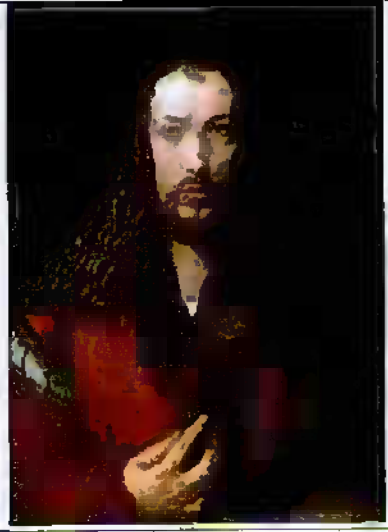
3 Альберт Дюрер (Альберт Дюрер)