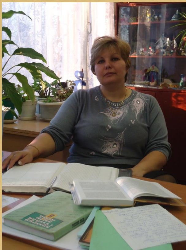
Представитель третьего поколения династии Харламовых