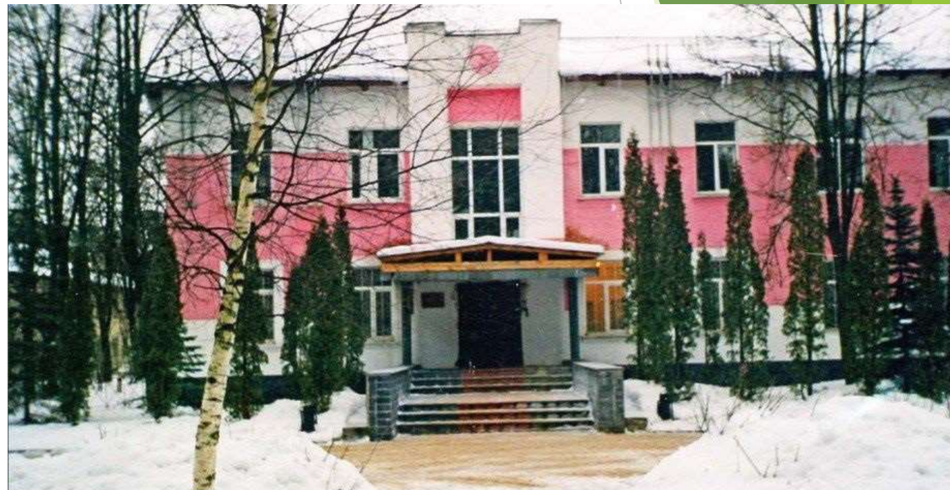
Одно из зданий санатория для рабочих в Городицах. Современный вид