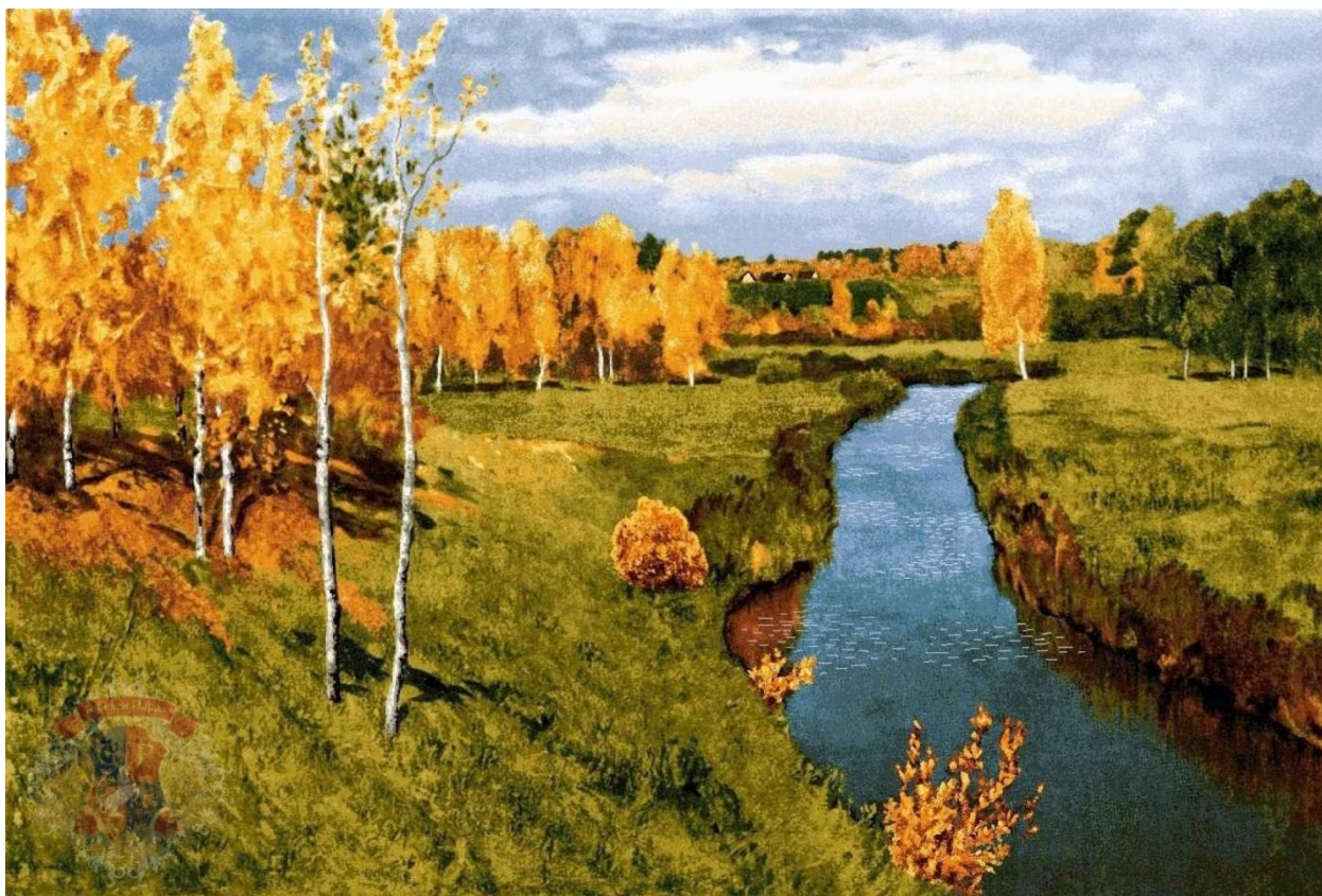
Левитан. Золотая осень